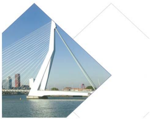
Schagen Lensen & van Krieken Accountants